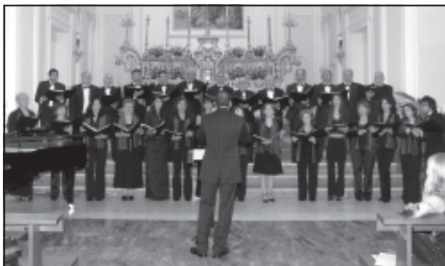
Corale Polifonica Angelicus