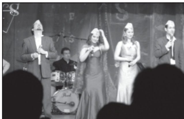
Március 19-én telt ház előtt mutatta be „Szabad a szving” című koncertjét a Cotton Club Singers együttes