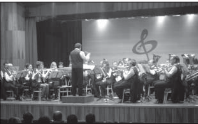
Nagy sikere volt a Bányász Zenekar farsangi koncertjének