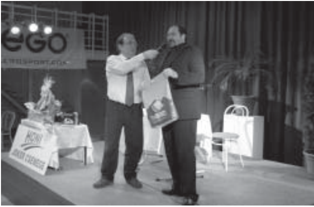
Az egyre sikeresebb Kávéházi beszélgetés sorozat legutóbbi vendége Nadas György humorista volt