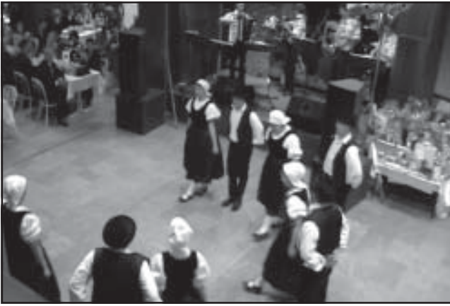
Február 10-én ismét megrendezésre került a Svábbbál