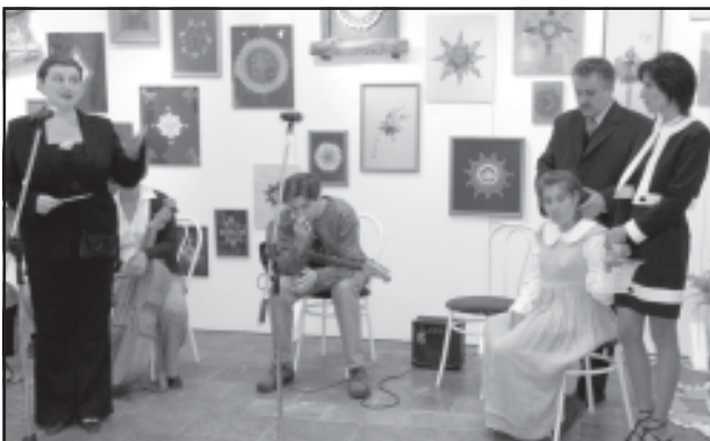
A kiállítás megnyitója

A szombat reggeli zenés ébresztő újabb rendezvényekre hívott: a dorogi bányász emlékművek koszorúzása után a Jubileum téren szórakoztató programok, mutatványosok,