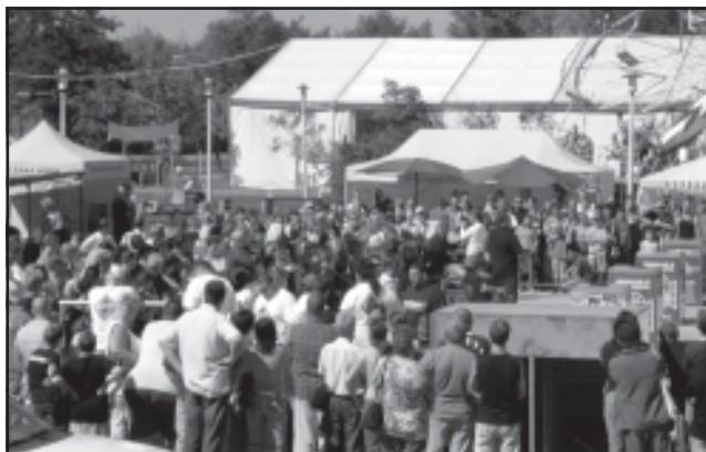
Folyamatos volt a sokadalom a Jubileum téren