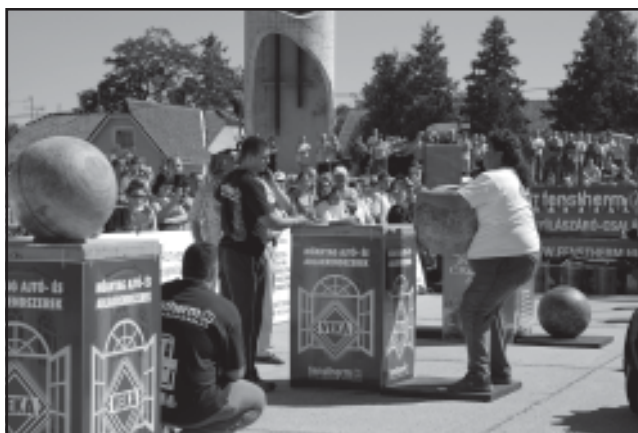
Az erős emberek versenyének izgalmas pillanata