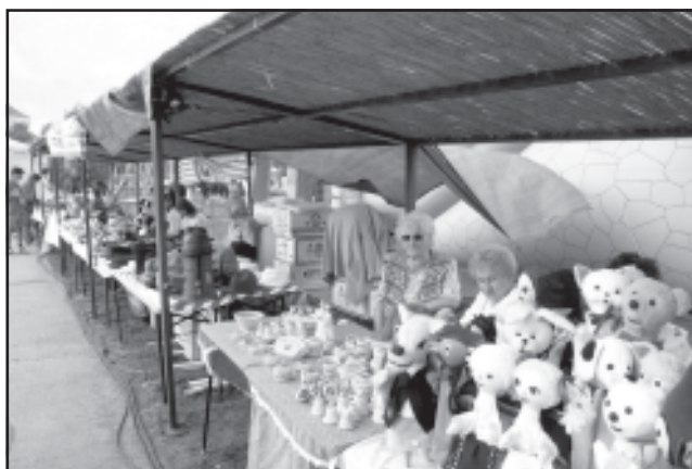
Színes és ízléses választék a népművészek standján