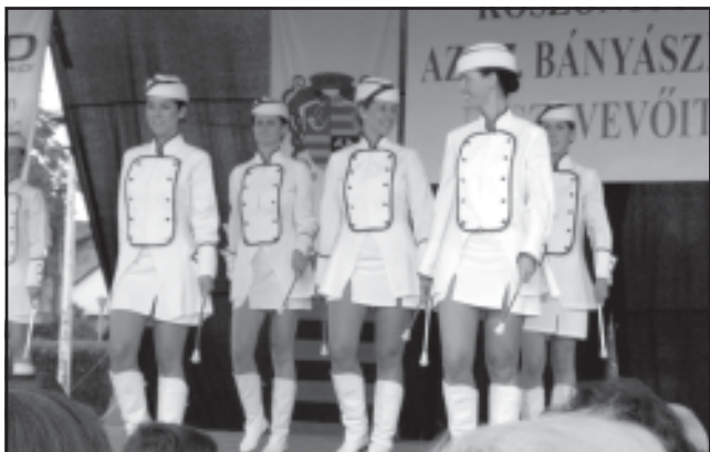
Mazsorett bemutató a színpadon