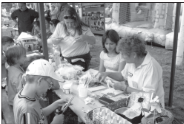
Játékos gyermekfoglalkozás a Jubileum téren