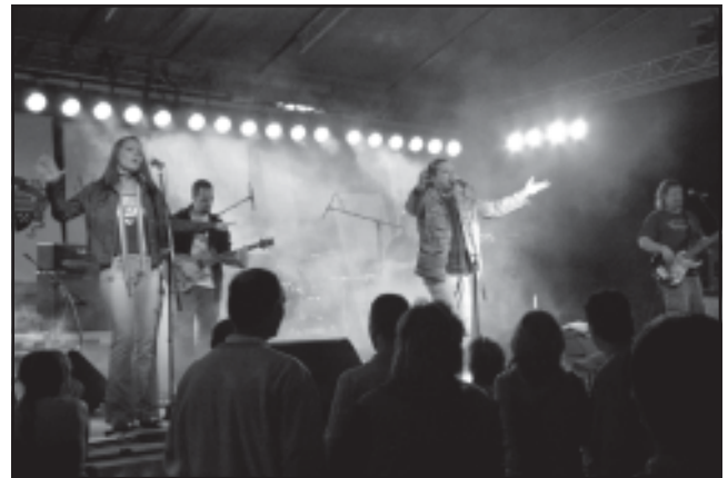
A Bon Bon együttes