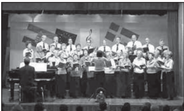
A XIII. Nemzetközi kórustalálkozóhoz adott otthont a művelődési ház a Musik Land utazási iroda szervezésében. Többek között fellépett a Dániából érkezett Kolding Bykør kórus is.