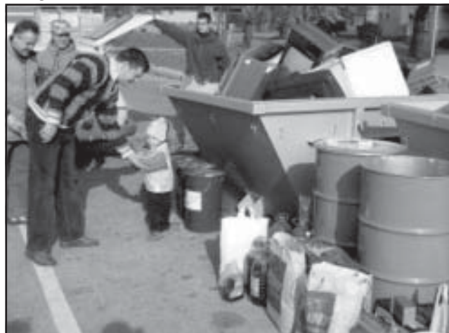
November 3-án 7,14 tonna veszélyes hulladék gyűlt össze