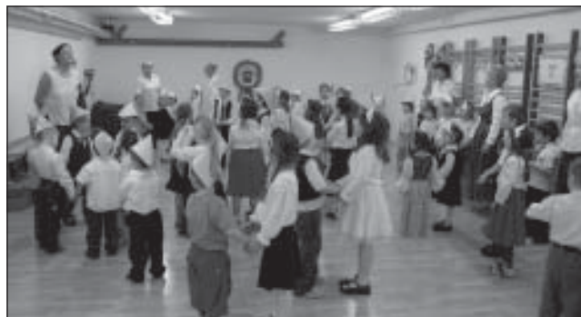
Táncházzal ünnepelték március 15-ét a Zrínyi óvodában. A gyerekek nagy lelkesedéssel vettek részt a játékos programon, ahol többek között verbunkost, legényest táncoltak, és korabeli dalokat énekeltek.