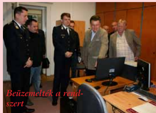
Beüzemelték a rendszert

Az önkormányzat a közterületi térfigyelő rendszer üzemeltetésével és kezelésével a polgármesteri hivatalban működő közterület-felügyeletet bízta meg.