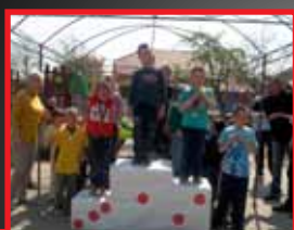
Újra Ovi olimpia