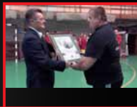
Emléklap az Erős embernek