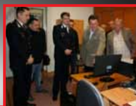
Térfigyelő kamerarendszert avattak