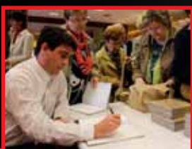
Könyvbemutató a Föld Napján