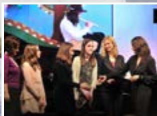
KODÁLY-VERSENYT NYERTEK A ZRÍNYISEK 5. OLDAL