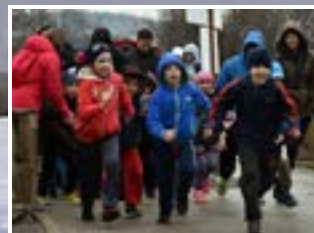
MINDENKI SPORTOLHAT DOROGON 7. OLDAL