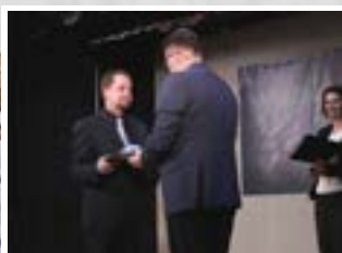
KOLONICS PÉTERÉ A RAUSCHER GYÖRGY DÍJ 2. OLDAL