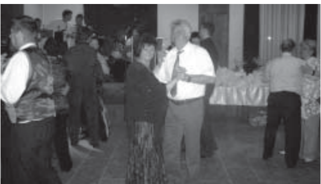
A Dorogi Szent Borbála Szakkórház és Szakorvosi Rendelő Kht. köszönetét fejezi ki azoknak, akik 2009. évi egészségügyi bált tombola és egyéb módon támogatták.