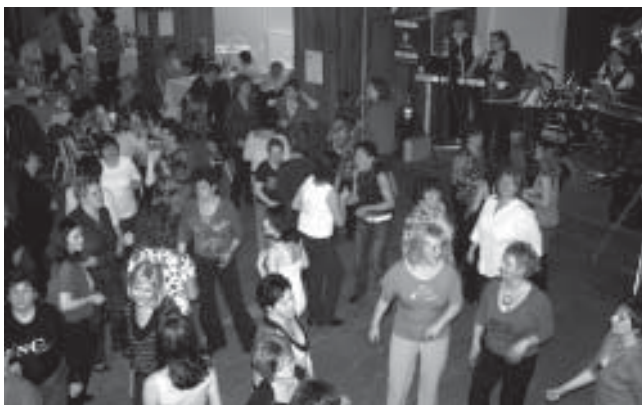
Fergeteges hangulatban báloltak a hölgyek Nőnap alkalmából a művelődési házban.