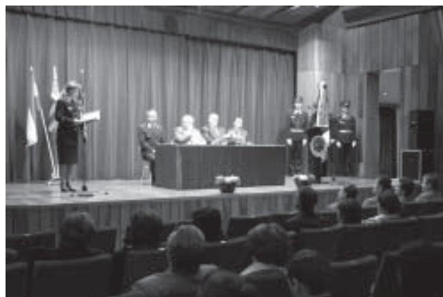
A Nemzetközi Polgári Védelmi Nap megyei rendezvényét február 26-án Dorogon tartották. Az eseményen a Katasztrófavédelmi Igazgatóság jutalmakat adott át.