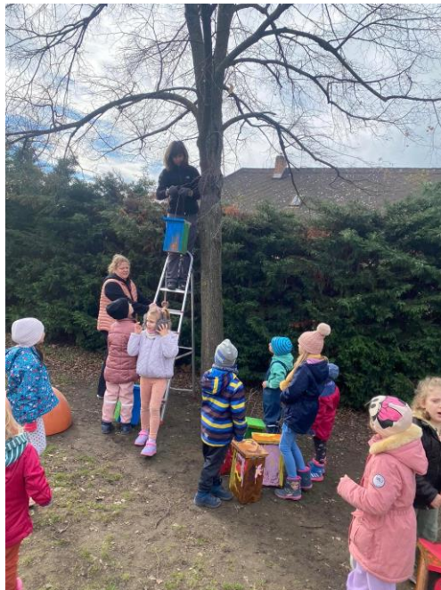
Madárodúk készítése, felhelyezése az óvoda fáira madarász segítségével

A változó világ hatása természetesen városunkra, a környezetünkben élőkre, a családok életkörülményeire is hatással van. Ezek a változások gyermekeink fejlődését is befolyásolják: a természettől való elszakadás, a technika fejlődése, a családok szerkezetének a változásai, a mozgásszegény életmód stb. Mindezek ismeretében nevelőmunkánk a pozitív hatások erősítésére és a negatív hatások gyengítésére, kompenzálására irányul.